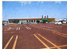
ウオロク東新保店