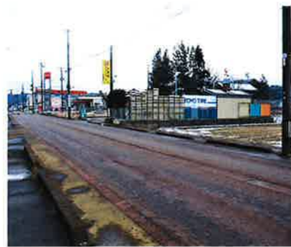
前面道路 市道 幅員12m 北側から東側に向けて撮影