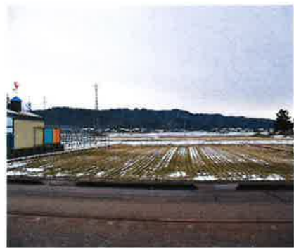
正面 北側から南側に向けて撮影