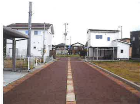
北側から南側に向けて撮影 右手前にN○19の区画があります。