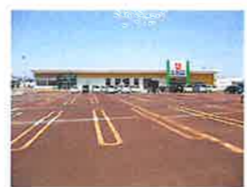
ウオロク東新保店