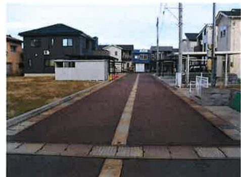
南側から北側に向けて撮影 左手前の更地が最後のN○19です。