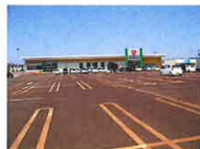
ウオロク東新保店