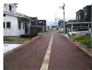
西側から東側に向けて撮影 この道路は団地の中央にあります。