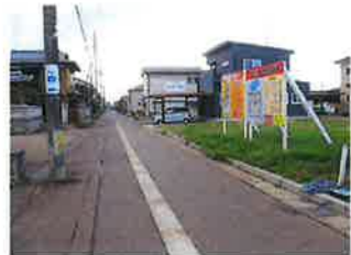
東側から南側に向けて撮影 右側に当該物件があります。