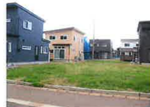
南側から西側に向けて撮影 (すぐ右側に看板)