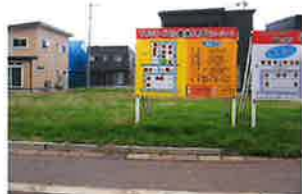
南側から北側に向けて撮影