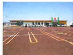
ウオロク東新保店