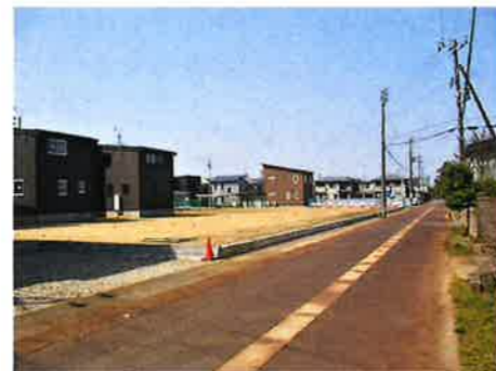
北側から西側に向けて撮影 左側に団地が出来ます。