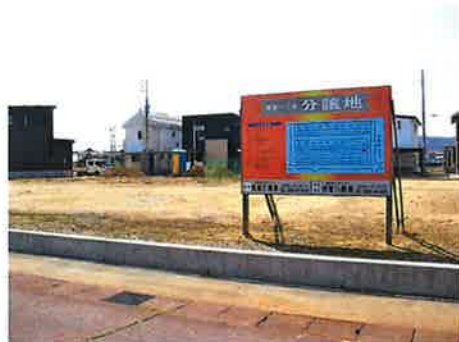
北側から南側に向けて撮影 正面に団地が出来ます。